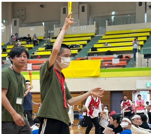
2024 ふれあいスポーツ交流会 聖火

今回の報酬改定は、事業所によっては大幅なマイナスを余儀なくされる改定であったが、心学塾作業所やあい愛の家にとっては、マイナスというよりプラスに働く報酬改定になったと言える。当初は「生活介護の基本報酬加算が、営業時間でなくサービス提供時間によってなされる」とのことで、通院等によってサービス提供時間が減った場合も、報酬が大幅に減算されるという「改悪」であった。そのため、多くの作業所で運営に支障が出ることになるため、あちこちで「送迎時間をサービス提供時間に含んでほしい」ことや「障害者個々の特性を配慮してほしい」という声があがった結果、「標準的なサービス提供時間については、送迎や障害特性等による配慮事項に該当する者の場合、個別支援計画に定めた標準的な支援時間で算定する事を基本とする」と一定の配慮がなされ、安堵することができたのである。